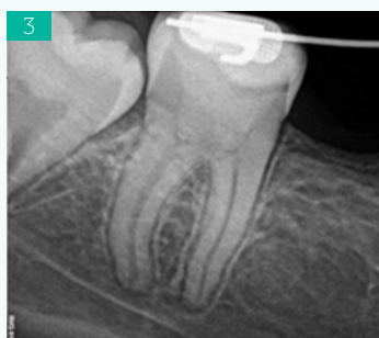
Ryc. 3. Zdjęcie radiologiczne zęba 47 wykonane podczas wizyty kontrolnej 3 lata po zakończonym leczeniu. Brak zapalnych zmian okołowierzchołkowych