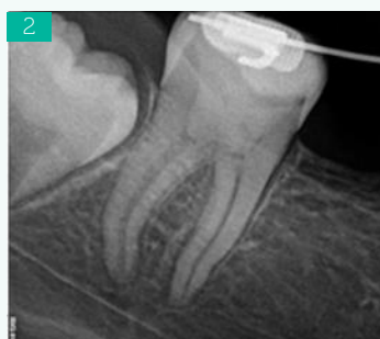
Ryc. 2. Zdjęcie radiologiczne zęba 47 wykonane podczas wizyty kontrolnej 2 lata po zakończonym leczeniu. Widoczne uformowane wierzchołki korzeni, fizjologiczne zwężenie światła kanałów korzeniowych oraz pogrubienie ścian korzeniowych. Brak zmian patologicznych w obrębie tkanek przyzębia wierzchołkowego