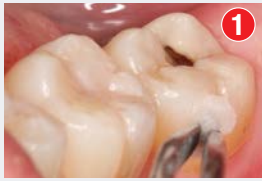
Ocena stanu żywotności miazgi