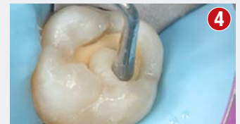
Warstwowa aplikacja kompozytu