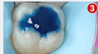
Aplikacja systemu wiążącego Etch&Rinse (całkowite trawienie) lub Self Etch (selektywne trawienie szkliva) na tkanki zęba oraz materiał Biodentine XP