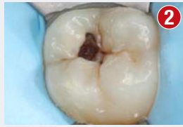
Izolacja zęba za pomocą koferdamu