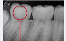
Pozabiegowa kontrola radiologiczna: Materiał Biodentine XP wypełnia szczelnie cały ubytek