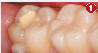
Ocena stanu żywotności miazgi