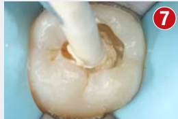
Aplikacja Biodentine XP bezpośrednio do ubytku dzięki użyciu specjalnego pistoletu. Końcówka naboju powinna dotykać dna ubytku, a stopień ugięcia można w tym celu lekko modyfikować. Wypełnić ubytek w całości materiałem Biodentine XP (technika Bio-Bulk Fill)