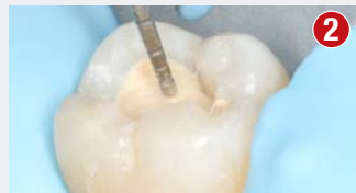
Usunięcie częściowo materiału Biodentine XP (min. 2 mm), aby stworzyć przestrzeń dla kompozytu