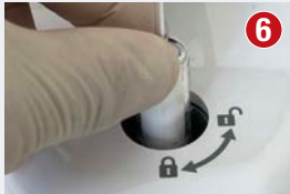
Zmieszanie materiału Biodentine XP za pomocą dedykowanego urządzenia Biodentine Mixer