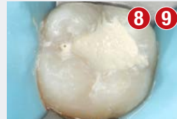
Sprawdzić adaptację materiału do pobrzeża ubytku oraz w razie konieczności lekko dociskając skorygować kształt anatomiczny. Wyłączyć ząb ze zgrzyzu