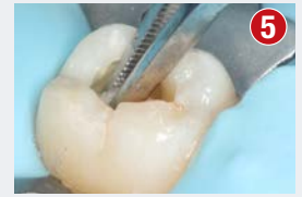
Uzyskanie hemostazy poprzez delikatne dociśnięcie wata (1-6% NaOCl)

W przypadku braku ściany stykowej adaptacja formówki anatomicznej