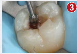
Usunięcie tkanek zmienionych próchnicowo

W przypadku braku ściany stykowej adaptacja formówki anatomicznej